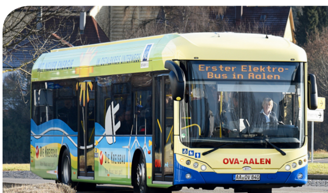
Der erste Linien-Elektrobus in Aalen