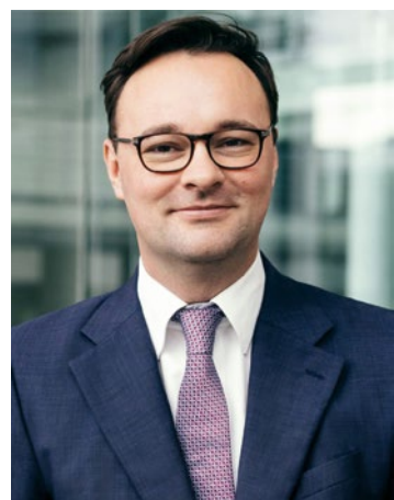
Oliver Luksic (FDP)