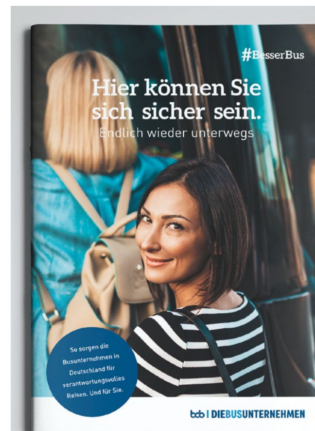
Eine neue bdo-Broschüre zeigt: Die Busbranche hat ihre Hausaufgaben längst gemacht

Ein wichtiger Punkt dabei ist: Ein hoher Anteil von Frischluft und eine gute Zirkulation sind entscheidend, um die Verbreitung von Aerosolen in einem geschlossenen Raum zu verhindern. Der Bus ist dabei das führende Verkehrsmittel und bringt die besten Eigenschaften mit. Innerhalb von nur einer Minute kann die Luft in einem Bus komplett ausgetauscht werden. Zum Vergleich: Im Flugzeug dauert dies viereinhalb Minuten. Und im Zug müssen Fahrgäste sogar sieben Minuten auf einen solchen umfassenden Luftaustausch warten. Mit modernen Filtersystemen lassen sich zudem über 99 Prozent der Partikel aus der Luft entfernen. Damit werden ähnliche Erfolge wie mit HEPA-Hochleistungsfiltren erreicht.