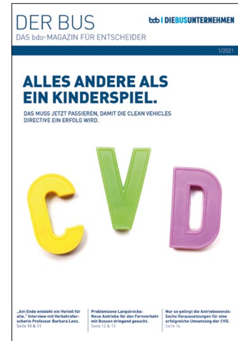
Neben dem Praxisleitfaden widmete der bdo auch eine Ausgabe seines Verbandsmagazins dem Thema CVD

Auch und gerade nach der Verabschiedung der CVD gilt: Die Umsetzung der Antriebswende ist eine Mammutaufgabe für das Busgewerbe, bei der passgenaue Informationen von allerhöchster Bedeutung sind.