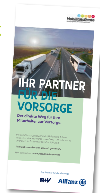
Ein starkes Bündnis für die betriebliche Altersvorsorge im Mobilitätssektor

ziehen die Prüflingenieure von TÜV SÜD und DEKRA auch die im freigestellten Schülerverkehr eingesetzten Kleinbusse den Prüfinhalten des Checks.