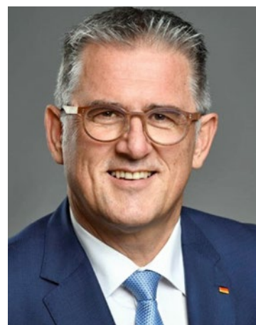
Michael Donth (CDU)