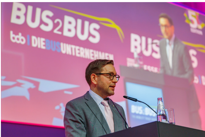
Pressebild 9: Andreas Kraus (Staatssekretär für Klimaschutz und Umwelt bei Senatsverwaltung für Mobilität, Verkehr, Klimaschutz und Umwelt) bei seiner Eröffnungsrede zur BUS2BUS 2026